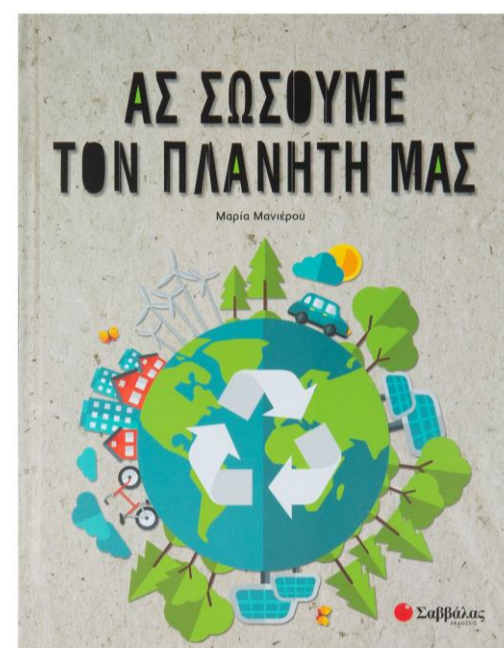
«Ας σώσουμε τον πλανήτη μας», Συλλογικό, Εκδόσεις Σαββάλας, 2020

Από τα απορρίμματα έως τους ρύπους των εργοστασίων και από τα πλαστικά έως τα διαστημικά σκουπίδια, ανακαλύψτε πού πηγαίνουν, πώς επηρεάζουν τον πλανήτη μας και τι μπορεί να γίνει ώστε να μειωθεί το πρόβλημα. Ένα βιβλίο γεμάτο με πολλές συναρπαστικές ιδέες που δείχνουν πώς μπορούμε να σώσουμε το περιβάλλον. Ξεκινώντας από μικρά εύκολα πράγματα και απλές αλλαγές στη ζωή μας, μπορούμε να μετατρέψουμε τον πλανήτη μας σε ένα καλύτερο μέρος για να ζήσουμε!