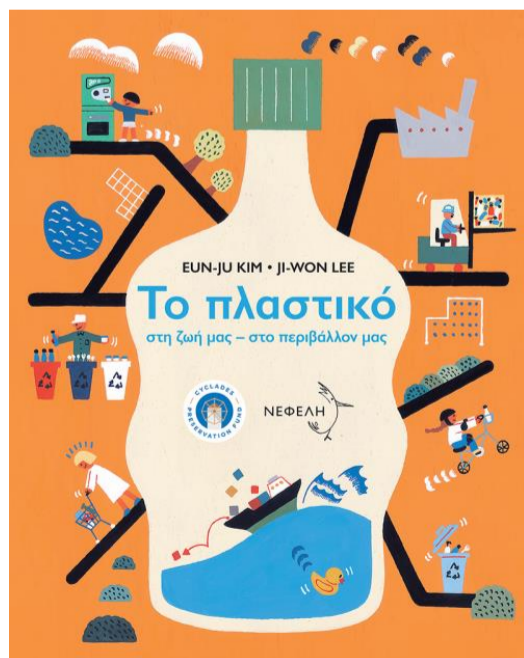
«Το πλαστικό στη ζωή μας, στο περιβάλλον», Kim Eun-Ju, Εκδόσεις Νεφέλη, 2020